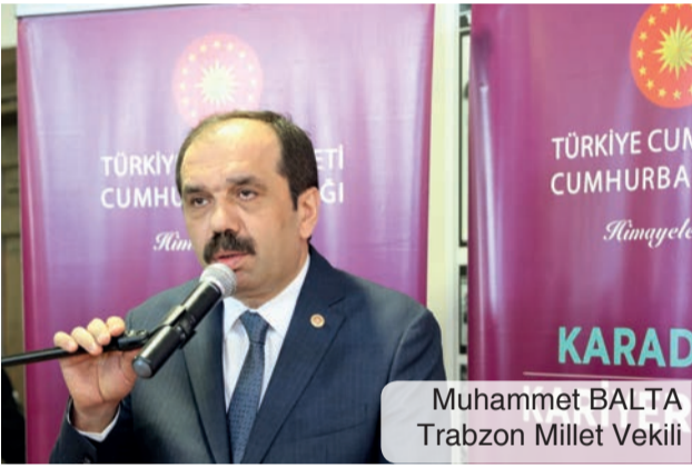
Muhammet BALTA Trabzon Milletvekili