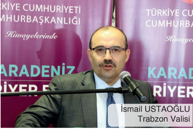
Ismail USTAOĞLU Trabzon Valisi

Türkiye Cumhuriyeti Cumhurbaşkanlığı himayelerinde Karadeniz Teknik Üniversitesi ev sahipliğinde ve Karadeniz Bölgesindeki 12 paydaş üniversitenin katkı ve katılımıyla 11-12 Mart 2019 tarihlerinde Karadeniz Kariyer Fuarı düzenlendi.