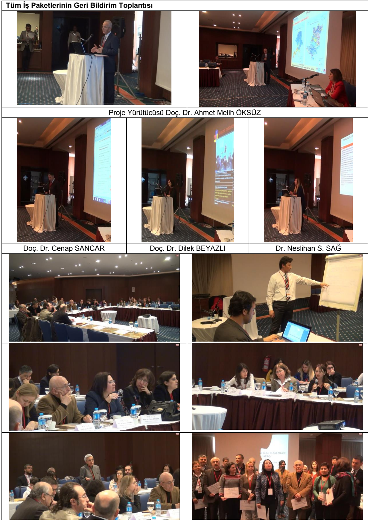
Tablo 1. İş Paketi ortak sunum toplantısı (06.02.2014).